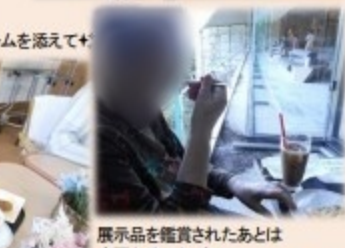
展示品を鑑賞されたあとは 庭園を眺めながら アップルパイを召し上がられました◎