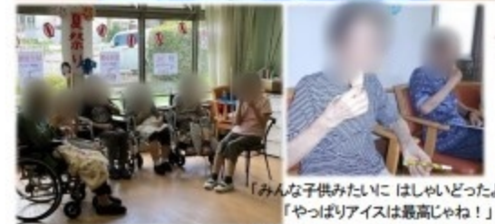
「みんな子供みたいにはしゃいだっただよ〜」 「やっぱりアイスは最高じゃね〜！」 景品引換券でゲットしたアイスクリームです◎ 召し上がりながら談笑され、夏祭りを最後まで堪能されました