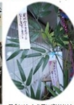
昼食には 七夕風に盛り付けた素麺と 揚げたての天ぷら盛り合わせをご用意しました！