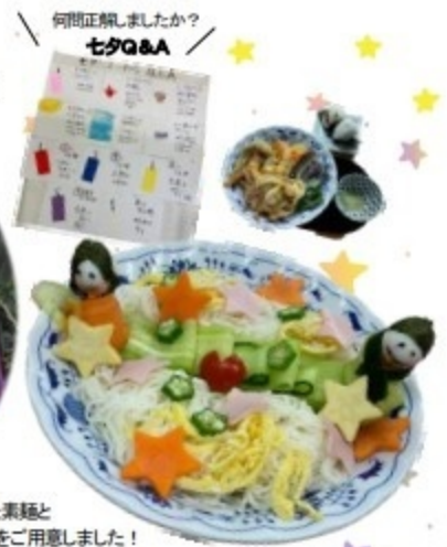
何問正解しましたか？ 七夕Q&A