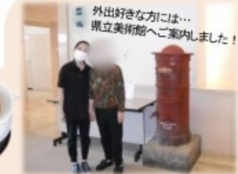
外出好きな方には... 県立美術館へご案内しました！