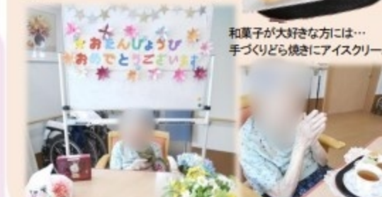
和菓子が大好きな方には... 手づくりどら焼きにアイスクリームを添えて