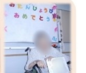
おめでとう おめでとう