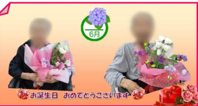
お誕生日 おめでとうございます

食中毒警報について 6月18日、広島県内全域に食中毒警報が発令されました。 施設内での食中毒の発生を防ぐ為、生もの持ち込みは、御遠慮くださいますようお願いいたします。